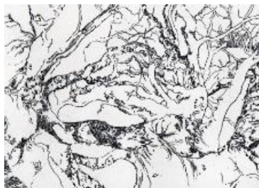
Gravure à l'eau-forte Dans le Hêtre Pilat, 10 exemplaires, 14 x 20 cm, 2020