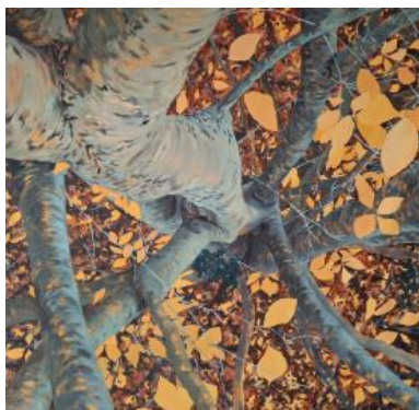
Peinture Le Hêtre Guevel, acrylique sur toile, 150 x 150 cm, 2024