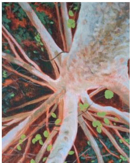
Peinture Sans titre, acrylique sur toile, 27 x 35 cm, 2024