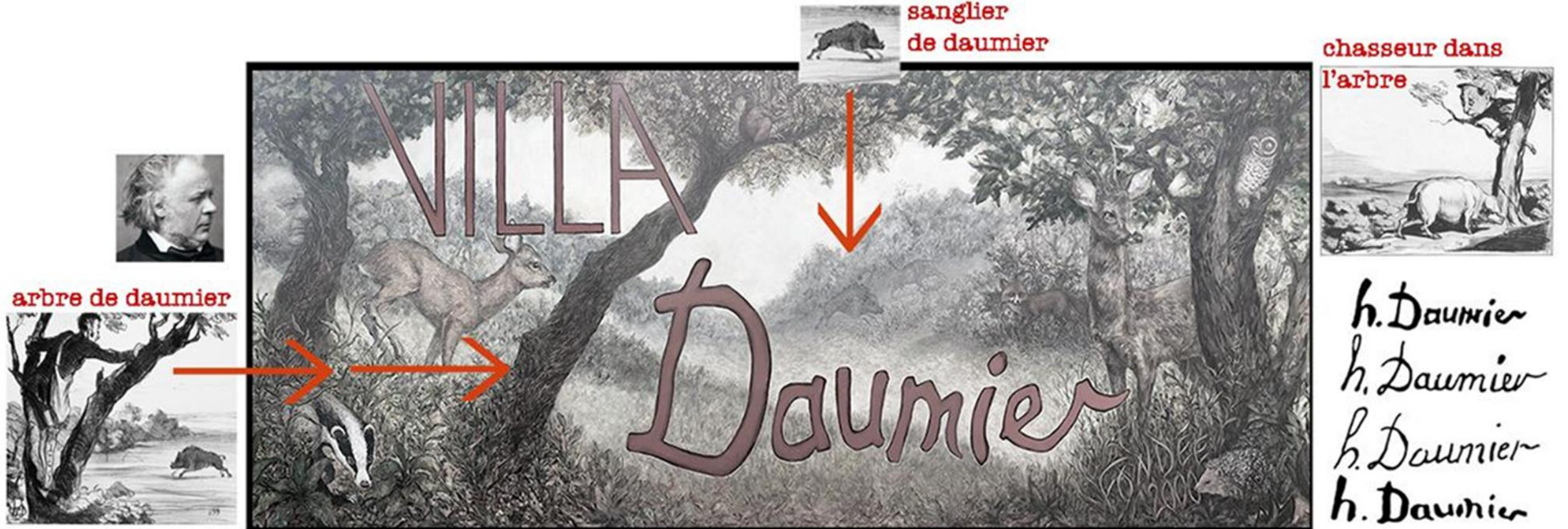
Peinture murale réalisée par Melissa FERREIRA, septembre 2021, façade ouest de la Villa Daumier