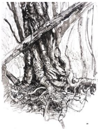
Dessin à l'encre de Chine sur papier, 21 x 29,7 cm, 2023