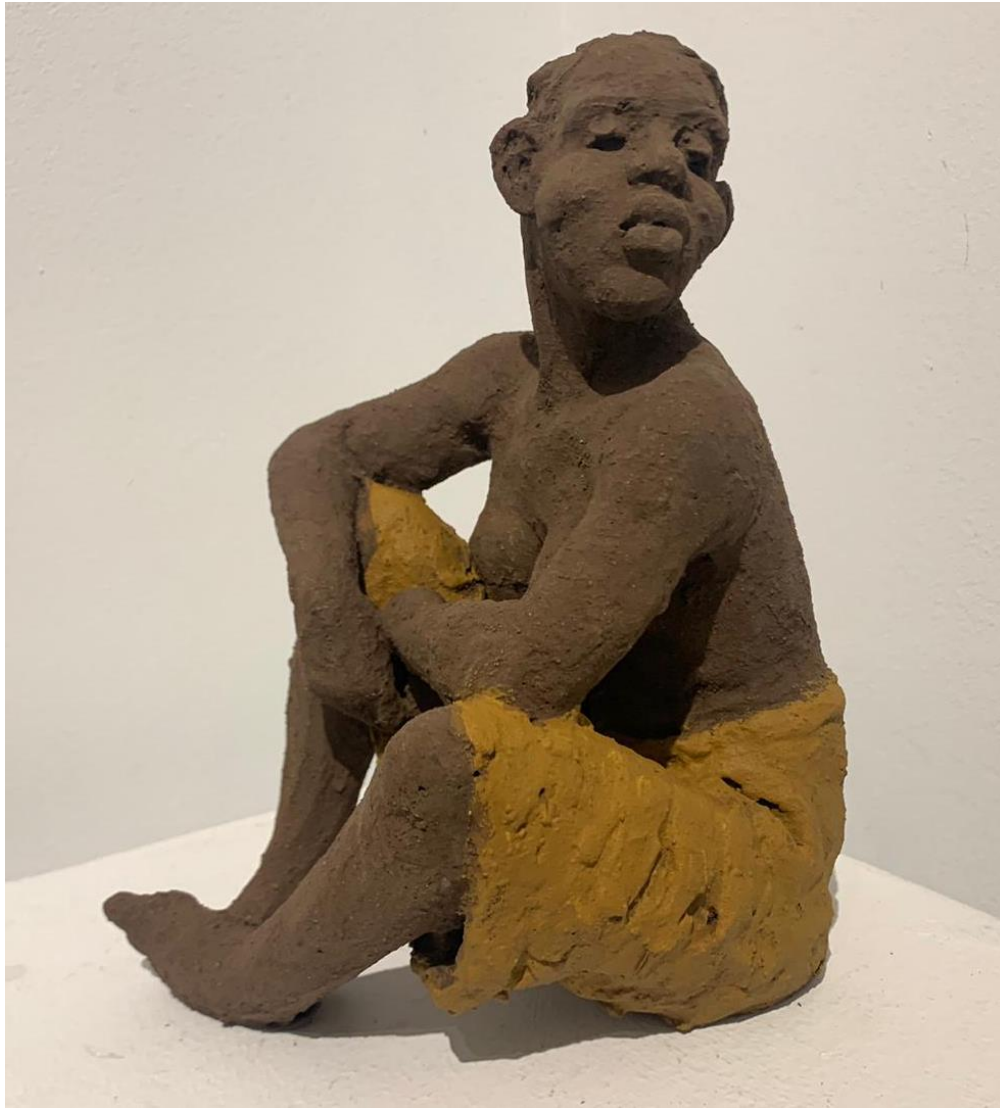
Luvuandu, pigments naturels sur terre cuite

La terre est l'ingrédient principal de mon travail, car elle m'apporte toute la douceur, la force et la chaleur qu'il faut à mon propos.